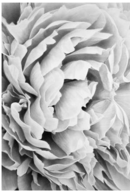
Robert Longo "Untitled (The Ecstasy of Saint Teresa, 1647-1652; After Bernini and White Peonies (detail))" (Pace Gallery)