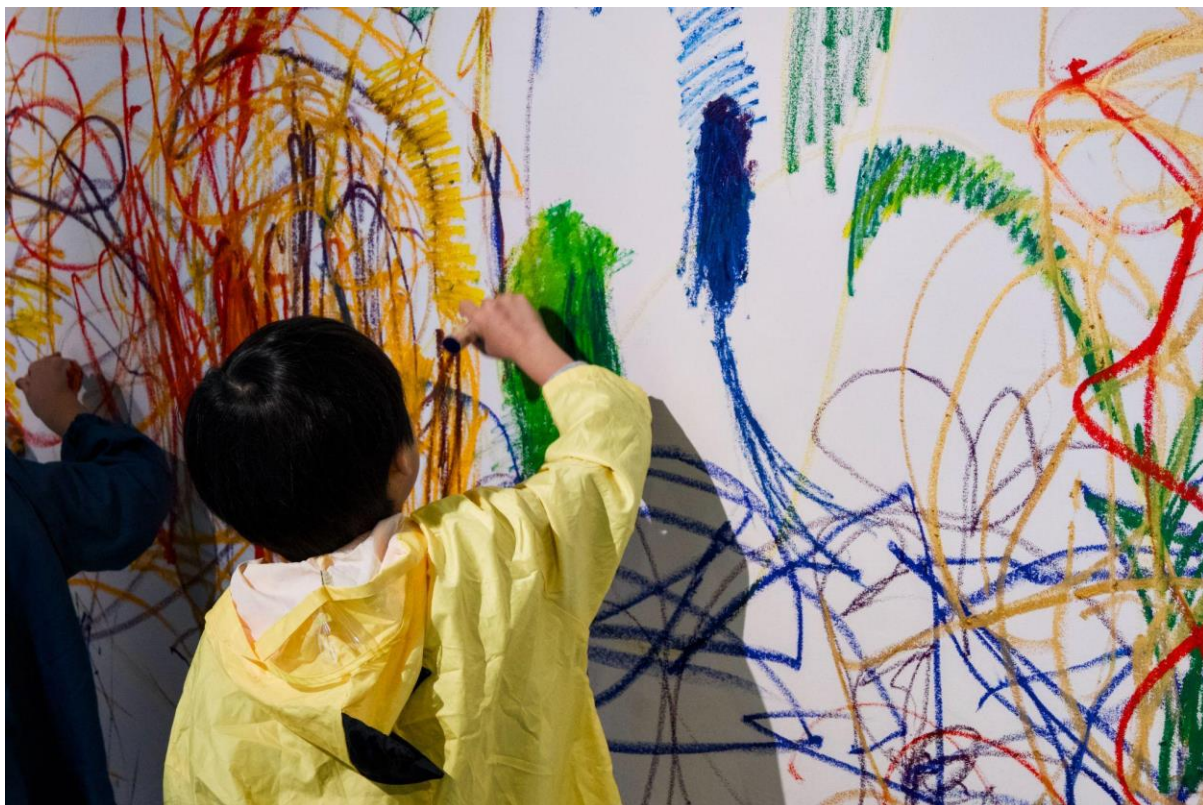
Gotoschoolによるワークショップの様子