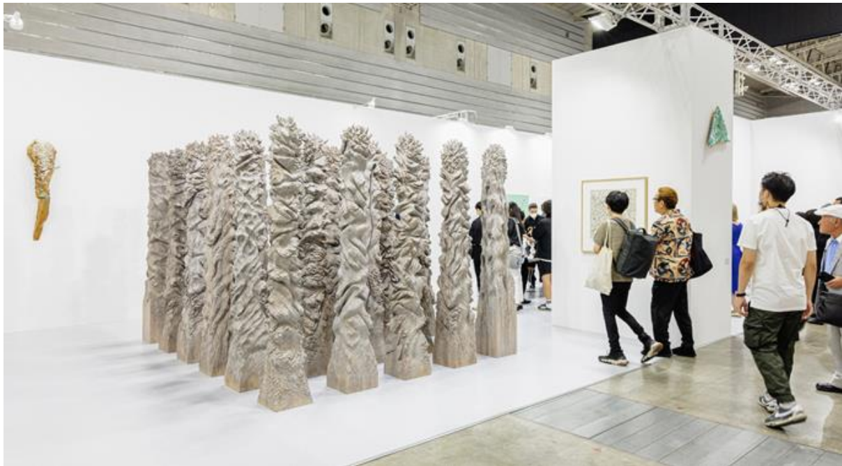
Tokyo Gendai, 2023